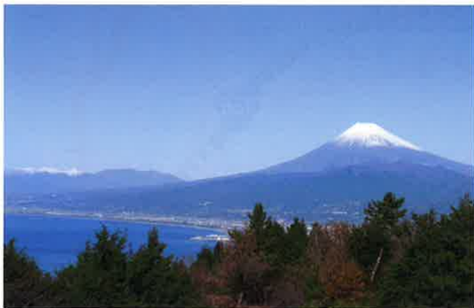
1 発端丈山からの眺望