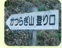
「かつらぎ山登り口」看板