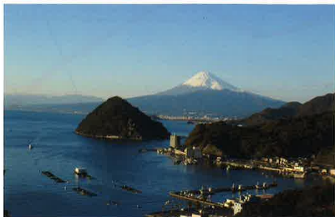
2 三津浜・長浜方面展望台からの眺望