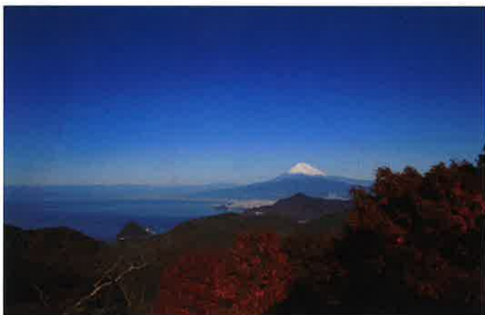
3 葛城山からの眺望